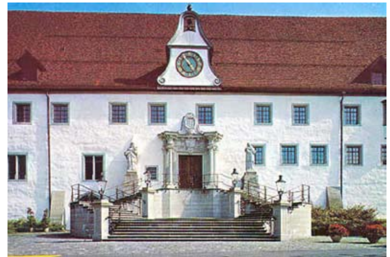
» » » PÄDAGOGISCHE HOCHSCHULE RORSCHACH » » »