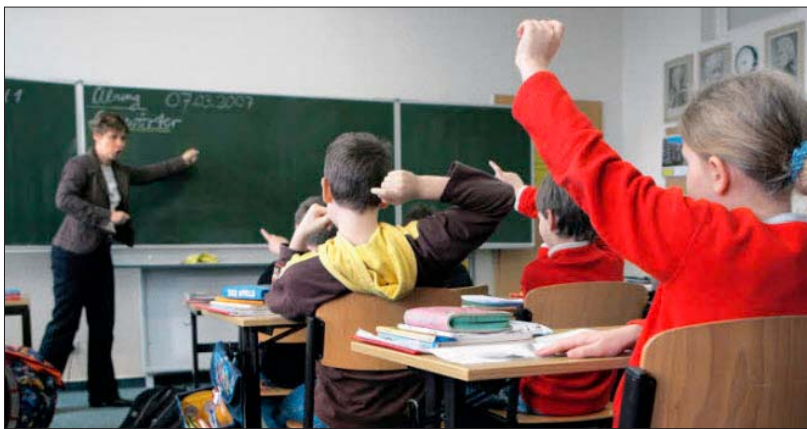
Neugier und Beteiligung sind gefragt in der Schule von heute.

Kahl: Es braucht eine gute Atmosphäre. Es braucht eine neue Institution, in der Kinder und Jugendliche willkommen sind und keiner sagt: Wo sind jetzt die blinden Passagiere? Wo sie nicht eingordnet werden, sondern daran geglaubt wird, dass in jedem viel mehr steckt, als wir uns vor-